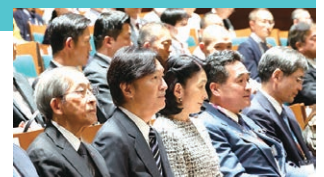
パネルディスカッションをご聴講になる秋篠宮皇嗣同妃両殿下

毎年秋に「全国犯罪被害者支援フォーラム」を開催。被害者等の方が被害後に置かれる状況や、支援活動の必要性を広報啓発しています。