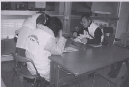
探しに来る方の為 に資料整理