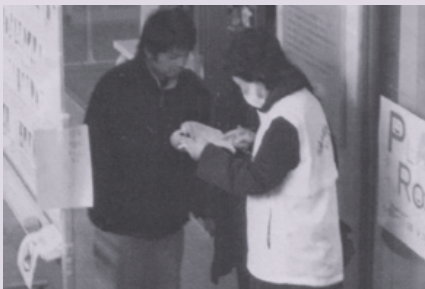
ご家族に対応する スタッフ