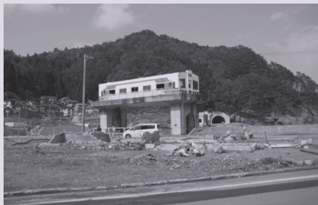
北リアス線付近の被災状況

しかし、記録によれば岩手県では、過去100年前後に今回の地震に匹敵する巨大地震・津波を2度も体験している。今から115年前の明治29年6月15日岩手県釜石沖を震源とする推定マグニチュード8.3前後の巨大地震・津波「明治三陸地震」により岩手県では、死者・行方不明者18,158人、家屋倒壊・流失約12,000戸、船舶流失約7,000隻等の被災。