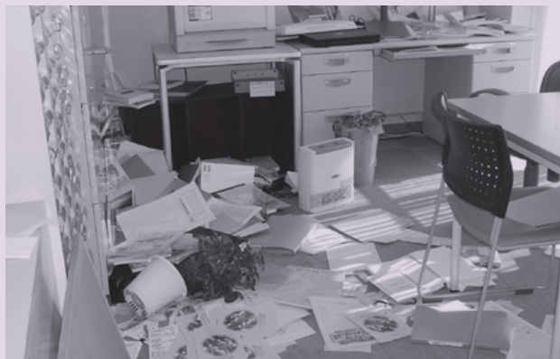
千葉犯罪被害者支援センター事務局の様子

ライン」～「出来事」の後の、ストレス反応（自然で、正常な反応）として、誰にも生じる心や体の変化をあらわしたものを～を作成し、関係市町村に送付し、避難所等にいる被災者の方々にお届けしました。