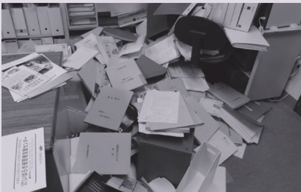
いばらき被害者支援センター事務局の様子