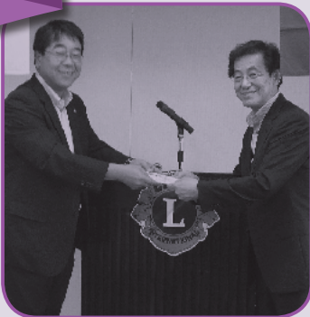
ライオンズクラブ贈呈式

長くご支援いただいている東京光が丘ライオンズクラブ様より10万円のご寄附をいただきました。全国被害者支援ネットワークは、今年も東京光が丘ライオンズクラブ様のご協力を得て、池袋駅前前で募金活動を行いました。